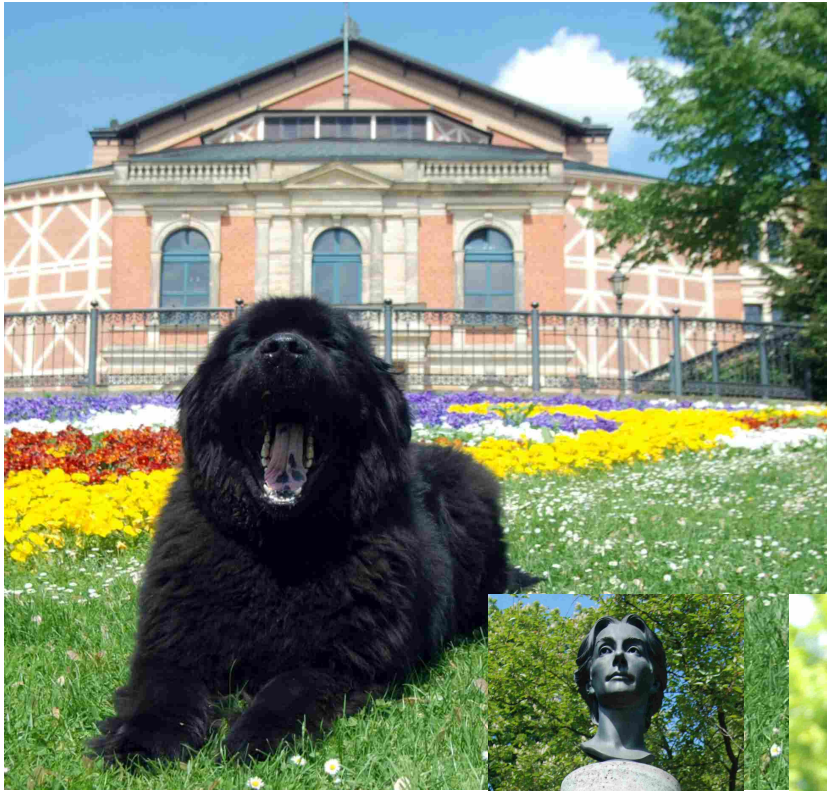
Richard Wagner •22. Mai 1813 †13. Februar 1883 Leitung der Festspiele: 1876, 1882